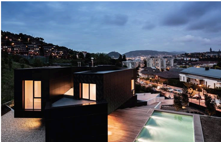
ASENSIO MAH Q House, Espanha

"A ARQUITETURA E A PAISAGEM." Algo importante na fotografia de arquitetura é mostrar a relação que a obra estabelece com a sua envolvente e de que forma esta se integra nela. Neste caso, a dupla de arquitetos e professores em Harvard propôs uma abordagem alternativa para a complexa topografia do terreno, pretendendo, com isso, uma relação mais direta entre a casa e o jardim.