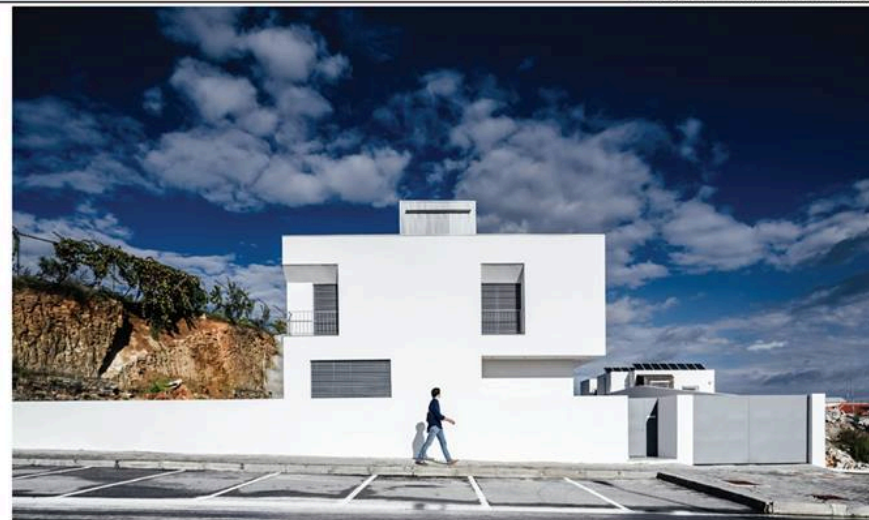
ADOFF ARQUITETOS Casa Lote 31, Mirandela, Portugal

Um denso revestimento de bloco de aglomerado cortiça envolve a totalidade do volume que se destaca da envolvente construída e procura integrar-se na paisagem de terrenos agrícolas ao seu redor.