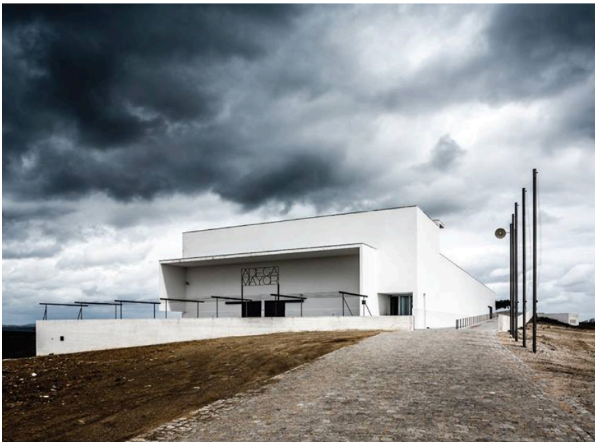
ÁLVARO SIZA VIEIRA Adegas Mayor, Campo Maior, Portugal

"SEM LUZ, NÃO HÁ ARQUITETURA." O céu estava completamente cerrado, mas, por instantes, uns raios de luz conseguiram passar pelas nuvens e conferir à fotografia todo este dramatismo.