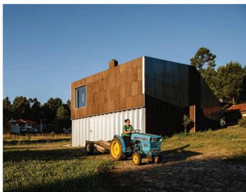
ARQUITETOS ANÓNIMOS Cork House, Esposende, Portugal

"A ARQUITETURA E A PAISAGEM." Algo importante na fotografia de arquitetura é mostrar a relação que a obra estabelece com a sua envolvente e de que forma esta se integra nela. Neste caso, a dupla de arquitetos e professores em Harvard propôs uma abordagem alternativa para a complexa topografia do terreno, pretendendo, com isso, uma relação mais direta entre a casa e o jardim.